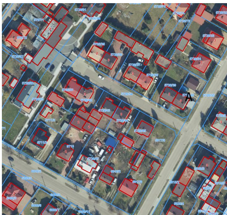
Rys. 4 Powierzchnia typowej zabudowy mieszkaniowej jednorodzinnej na obszarze opracowania

Zwiększenie wskaźników urbanistycznych wynikało m.in. z istniejącego zagospodarowania. Na terenie opracowania istniejąca zabudowa charakteryzuje się wysokim wskaźnikiem powierzchni zabudowy w wysokości średnio od 30 do 40 %. Taki stan rzeczy ogranicza lub niektórych przypadkach uniemożliwia rozbudowę/nadbudowę istniejących budynków w oparciu o zapisy obowiązującego planu.