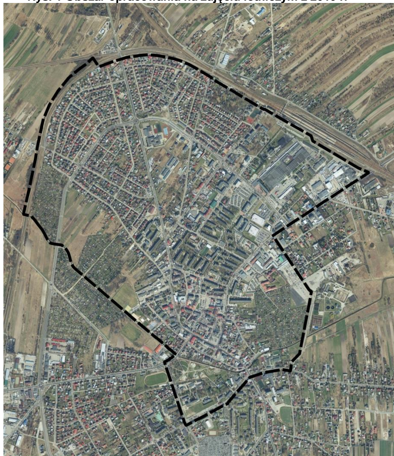
Rys. 1 Obszar opracowania na zdjęciu lotniczym z 2019 r.

Przedmiotem opracowania jest projekt miejscowego planu zagospodarowania przestrzennego miasta Łuków dla terenu położonego w Łukowie pomiędzy terenem PKP, rzeką Krzną Południową, ul. Doktora Andrzeja Rogalińskiego, ul. Partyzantów, ul. Cieszkowizna, ul. Prusa i ul. Międzyrzeczką. Zakres prognozy reguluje art. 51 ustawy z dnia 3 października 2008 r. o udostępnianiu informacji o środowisku i jego ochronie, udziale społeczeństwa w ochronie środowiska oraz o ocenach oddziaływania na środowisko.