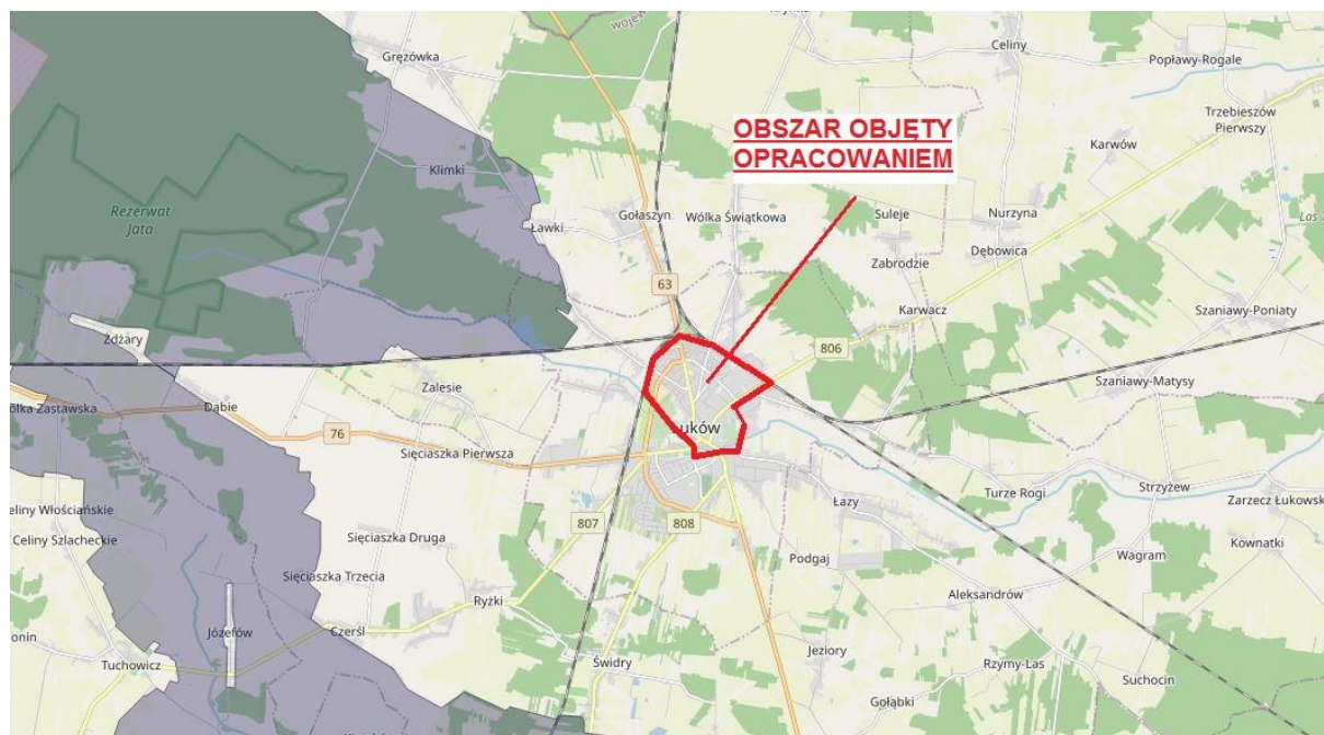
Rys. 5 Projekt korytarzy ekologicznych łączących Europejską Sieć Natura 2000 w Polsce w odniesieniu do granic obszarów. Jędrzejewski W., Nowak S., Stachura K., Skierczyński M., Mysłajek R. W., Niedziałkowski K., Jędrzejewska B., Wójcik J. M., Zalewska H., Pilot M., Górny M., Kurek R.T., Ślusarczyk R. Zakład Badania Ssaków PAN, Białowieża 2011